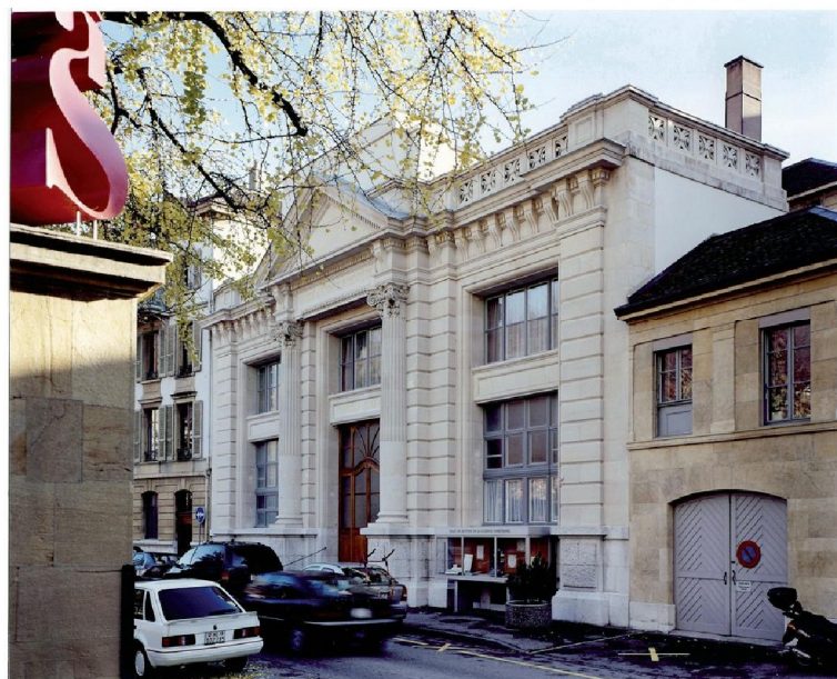
Eglise de Neuchâtel,