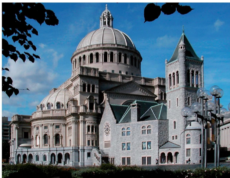
Eglise Mère de Boston,