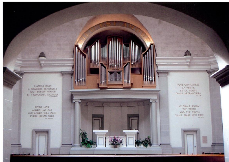
Eglise de Genève